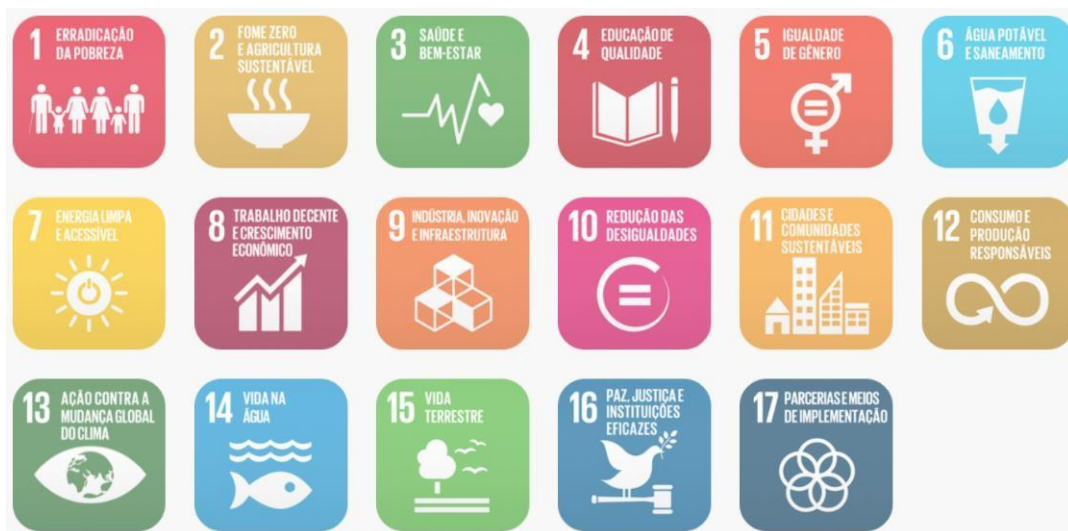
Figura 02: Objetivos de Desenvolvimento Sustentável