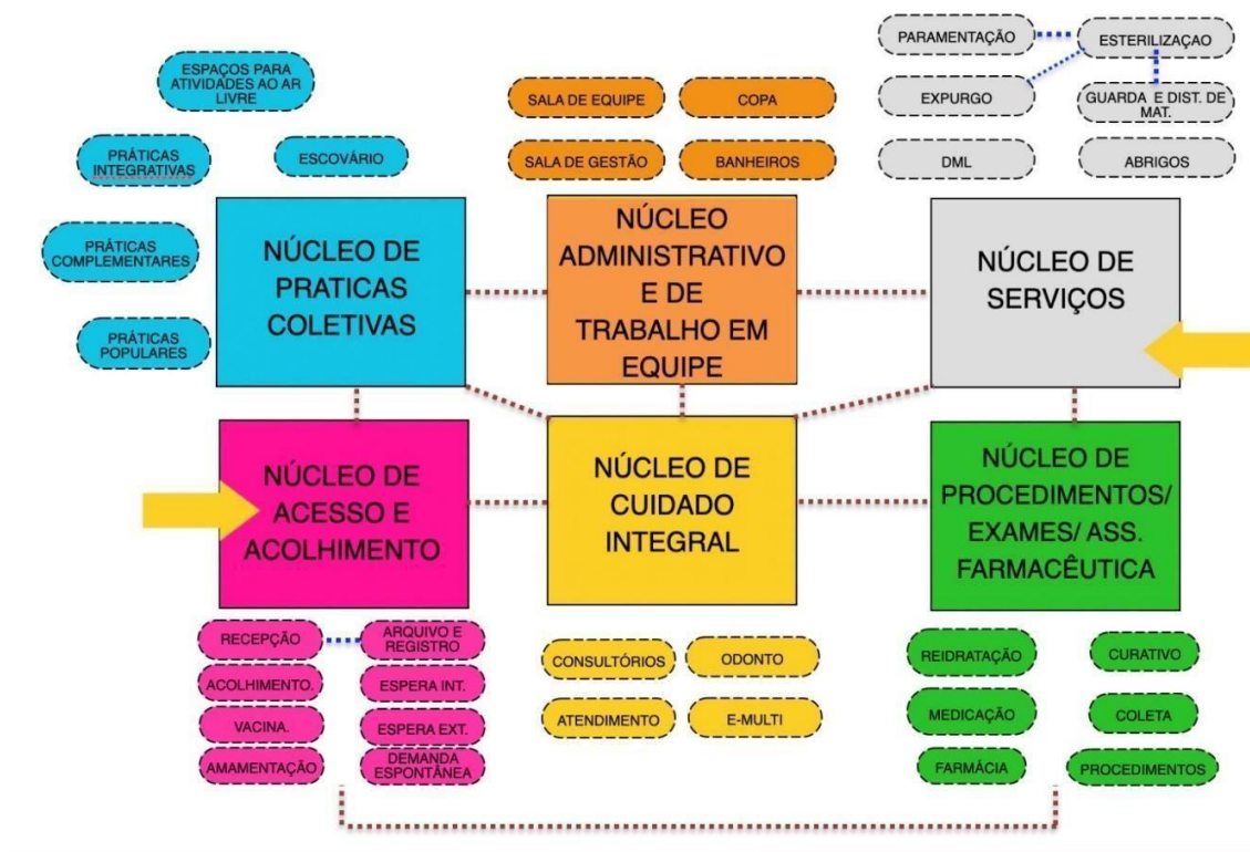
Figura 1: Diagrama de Massas